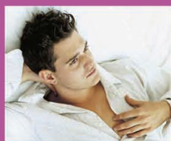
Concerti: Michael Bublé a Verona