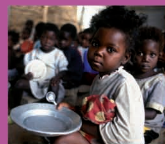
Mosaico Scienze 2010: i problemi dell'alimentazione