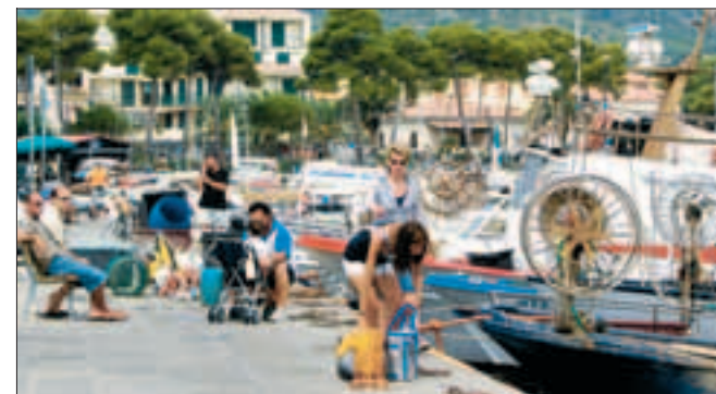
En af de større havne på Elba, hvorfra der stadig fiskes og sælges til de lokale restauranter.

Man finder kitchet krams med Napoleons motiv mange steder.