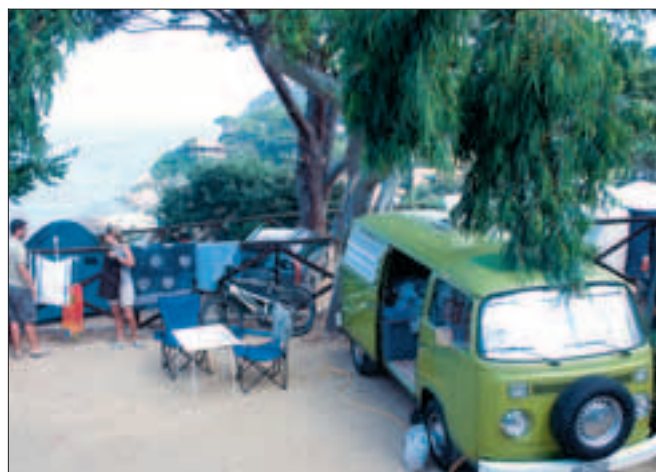
En af måderne at overnatte på. Her campingpladsen med havudsigt ved Scaglieri.