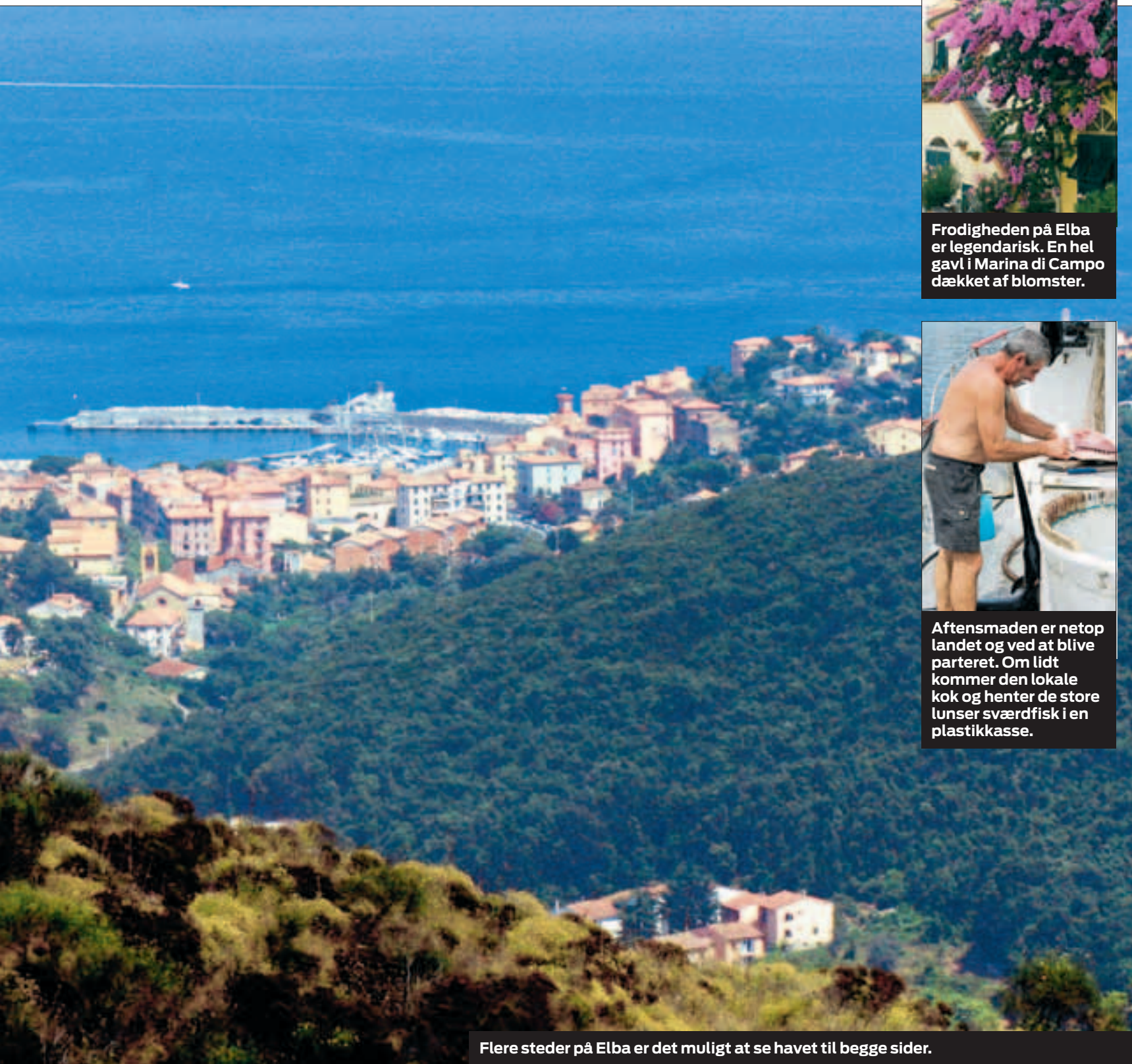
Flere steder på Elba er det muligt at se havet til begge sider.

Det er lettere at se cool ud med min hest Daisy, som er roen selv.