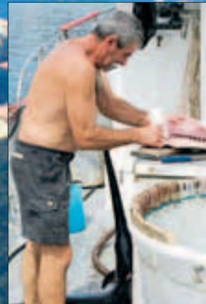
Aftensmaden er netop landet og ved at blive parteret. Om lidt kommer den lokale kok og henter de store lunser sværdfisk i en plastikkasse.